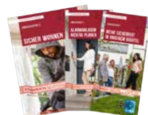
Broschüren zum Thema erhalten Sie bei Ihrer örtlich zuständigen Polizeidienststelle oder über die kriminalpolizeiliche Beratungsstelle.