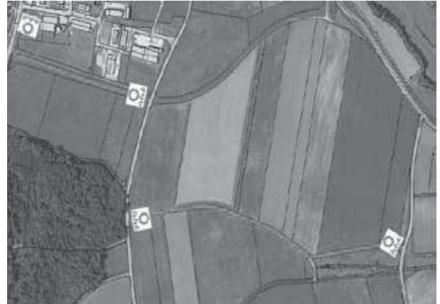
Feldwege zwischen den Gemeindeverbindungsstraßen Wippendorf und Gebersdorf, südlich Gewerbegebiet