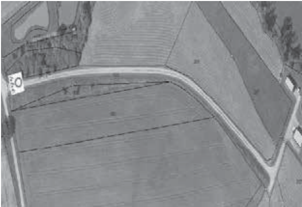
Feldweg zur Kläranlage