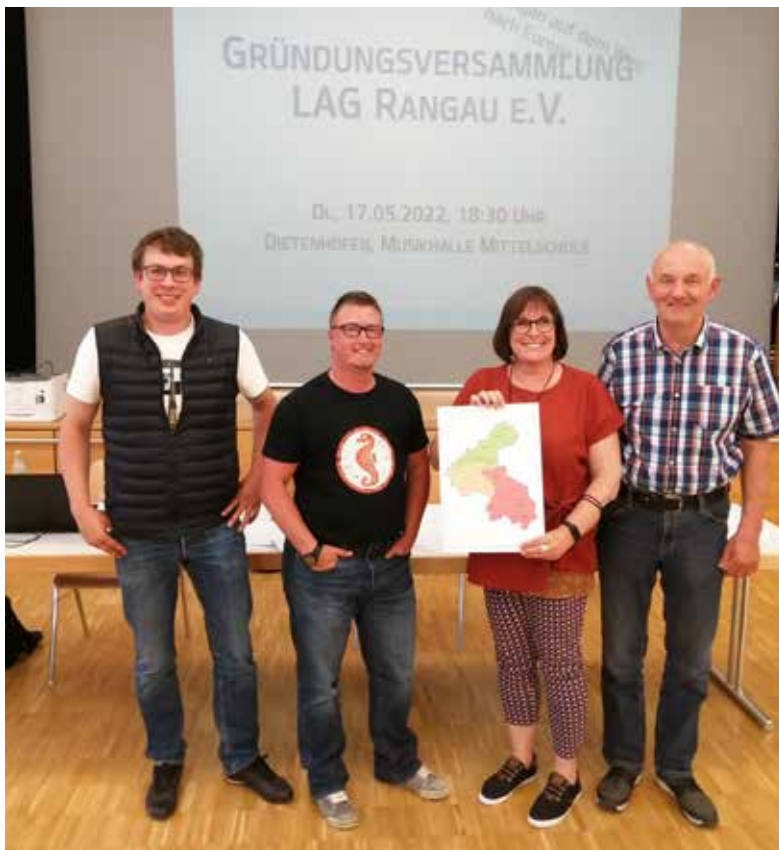
Teilnehmer an der Vereinsgründung aus Bruckberg