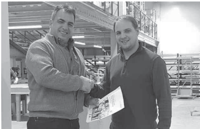
Florian Stern von Insetto GmbH in Weihenzell

Wir danken deshalb herzlichst allen nachfolgenden Sponsoren, hier bei der Übergabe der Patenschaftserklärung, die uns finanziell bei der Umsetzung dieses Gesundheitsprogramms unterstützen: